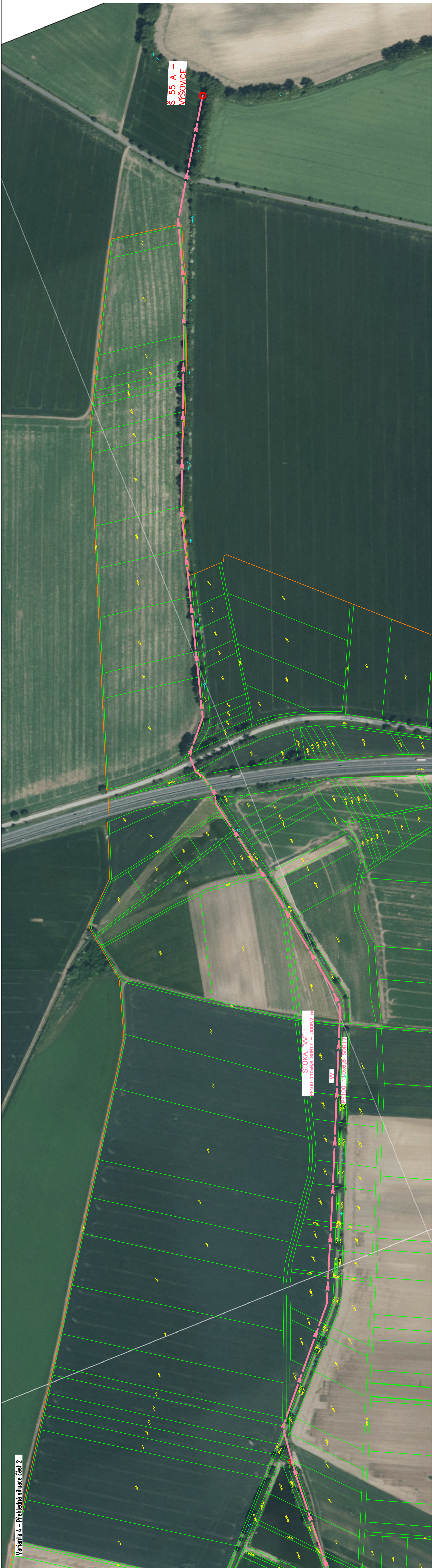
Varianť 4 – Přehledná situace část 2